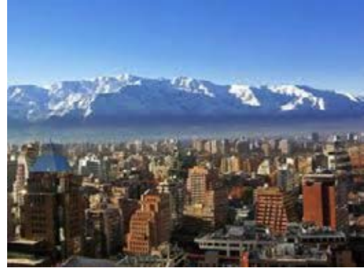
Die Hauptstadt Santiago liegt den Anden zu Füßen