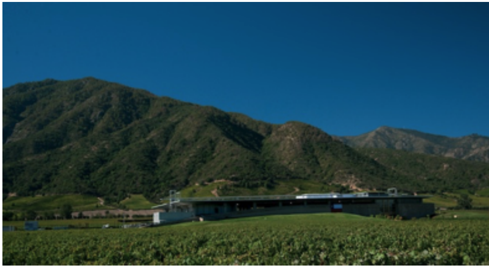
Links: Zur Gänze nach Feng-Shui Prinzipien errichtetes Weingut, unten: „Fuegos de Apalta“ Restaurant