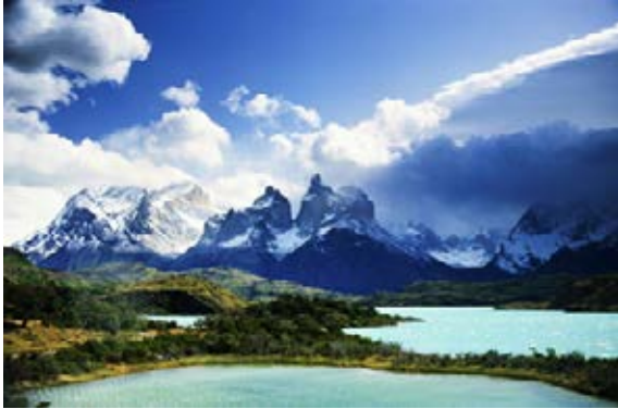
Die eindrucksvollen Gipfel von Torres del Paine in Patagonien

Europäisches Flair zwischen Anden und Pazifik. Endlose Wüsten und feuerspeiende Vulkane, Weinberggärten und Kaktussteppen, unendliche Sandstrände und majestätische Felsenfjorde, tiefblaue Seen und Weideland, sattgrüne Urwälder und eisblau schimmernde Gletscher, die ins Meer kalben. Chile, das schmale, lange Land am Ende der Welt, vereint fast alle Klimazonen, und bietet enorme landschaftliche Kontraste und ist die ideale Heimat für Weinbau.