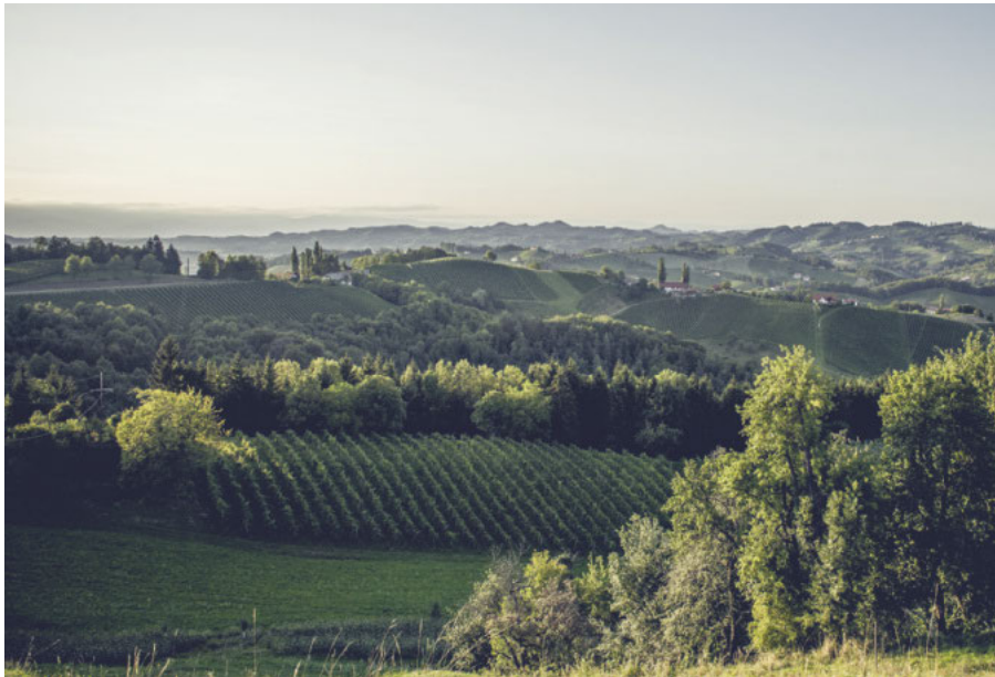
Auf den steilen Höhenlagen wachsen in mühevoller Handarbeit charaktervolle Weine