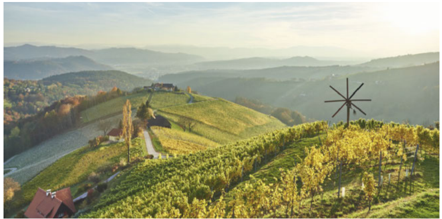
Weingut Wohlmuth: Blick von der Ried Hochsteinriegl mit dem typischen Klapotetz

Tement: Unser Ziel ist es, dass unsere Weine zeitlos und elegant werden sollen. Sie sollen ausdrücken, was wir machen, wo wir sind und wie wir sind.